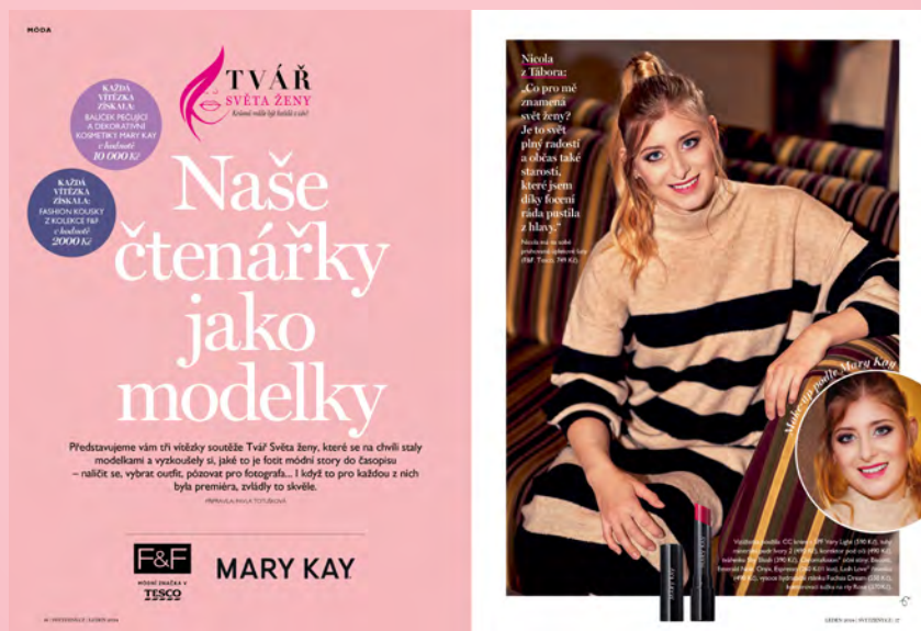
Tvář Světa ženy, ročník 2023